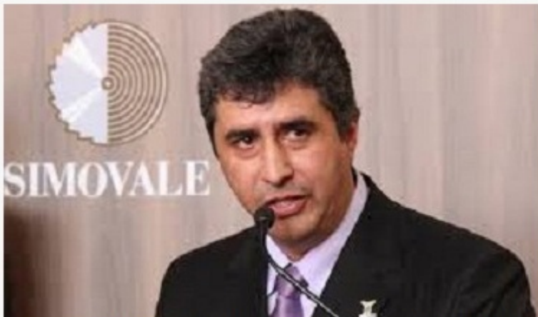
Sinduscon e Simovale são apoiadores do Encontro do Empresário

O encontro acontecerá dia 25 de julho em Chapecó.