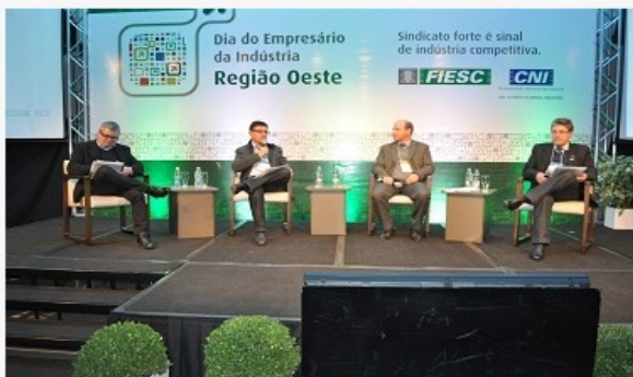
A competitividade da indústria em foco

Debater iniciativas que visam tornar a indústria brasileira mais competitiva.