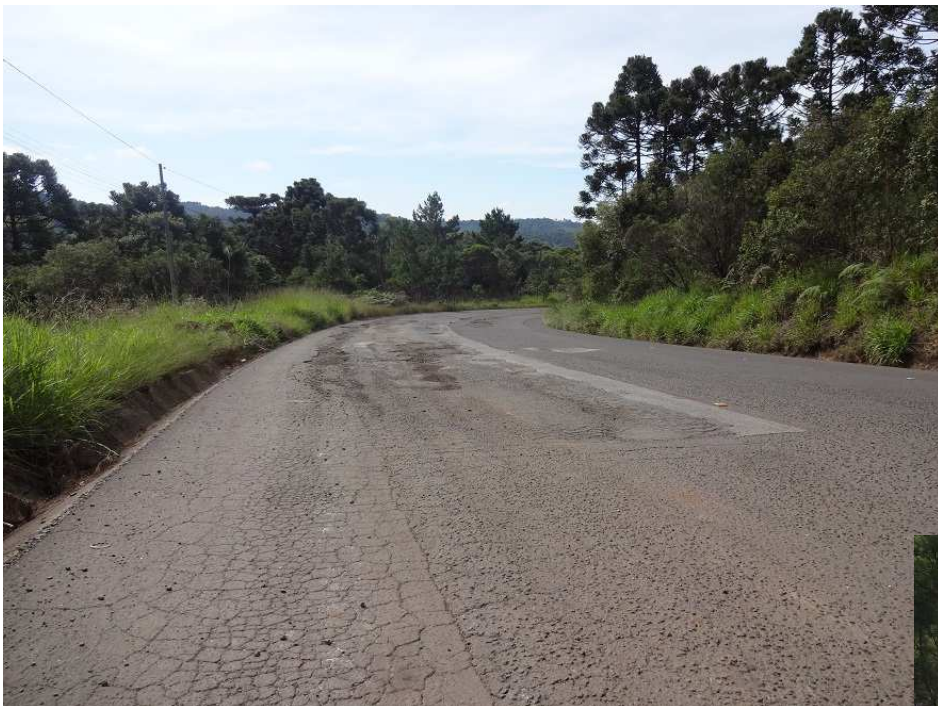
Km 12,8 – Buracos e afundamento do pavimento