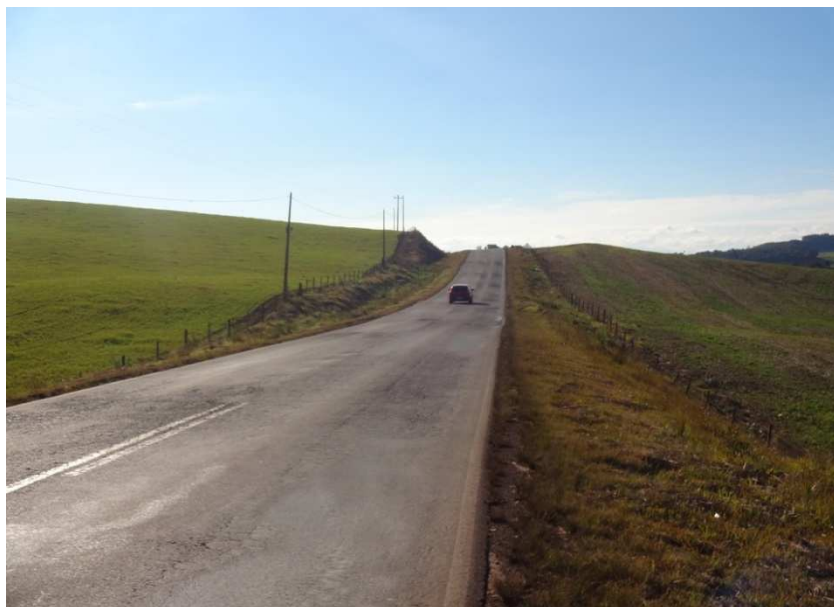
Km 33 – Trincamento e desagregação do pavimento