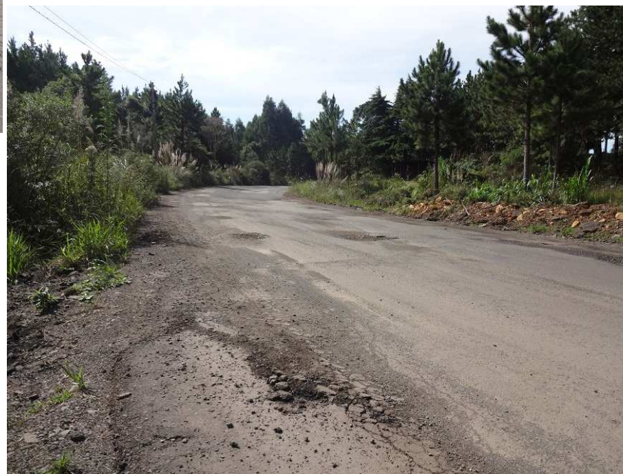
Km 21,5 – Afundamentos e recalques na pista.