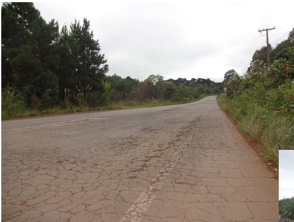
Segmento entre Taquara Verde/ BR-153 – km 163,7- Trincamento do pavimento