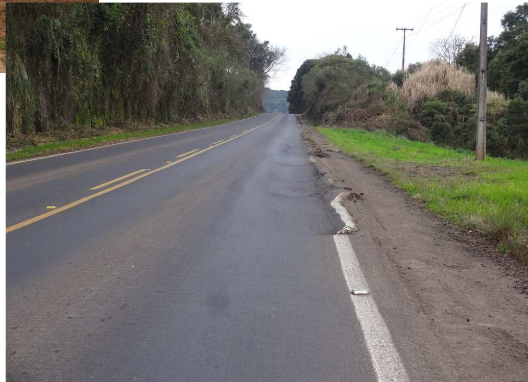
Km 16,4 – Situação do pavimento