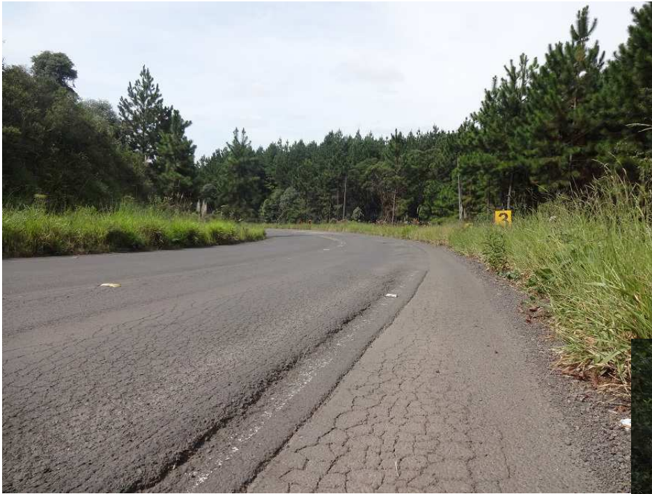
Km 8,5 – Trincamento e desagregação do pavimento