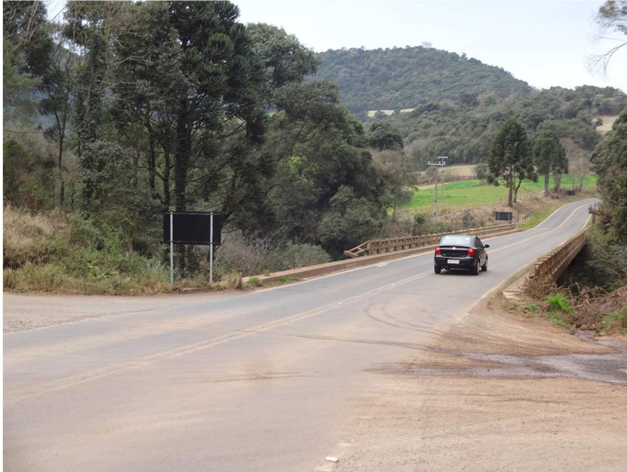
Ponte sobre o Rio Santo Antônio – km 25,0