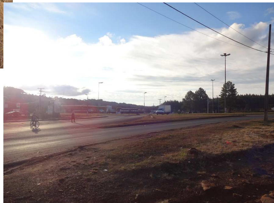
Entroncamento das Rodovias SCs 355 e 350, em Lebon Régis