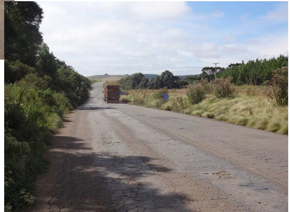
Km 116 – Desagregação do pavimento