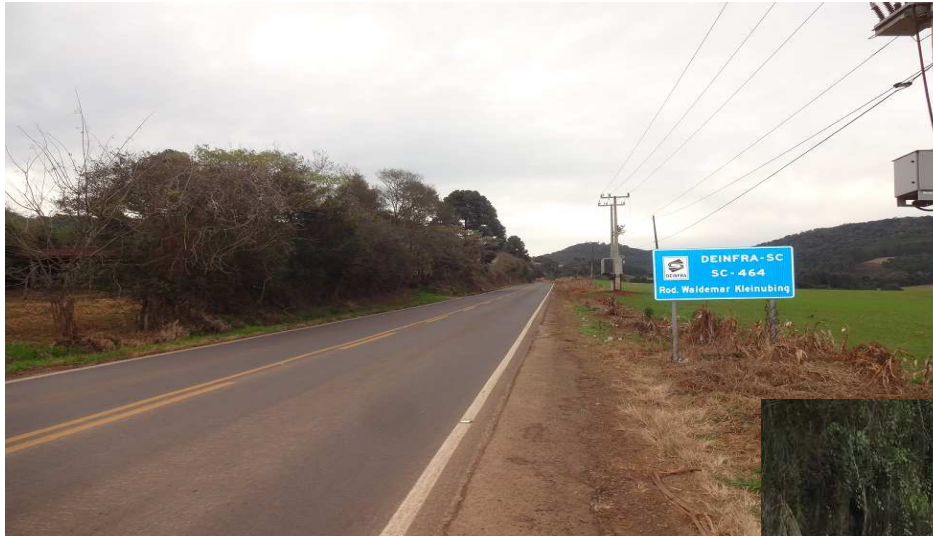
Km 0,0 ( No entroncamento com rodovia para Treze Tílias)