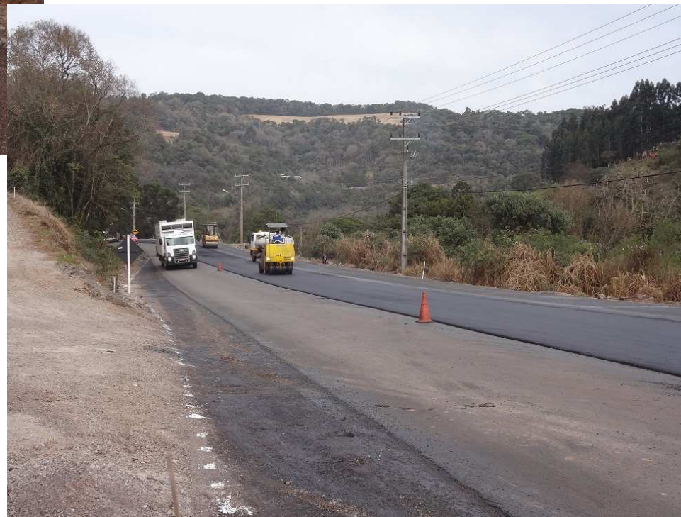
Recapeamento no km. 7,5