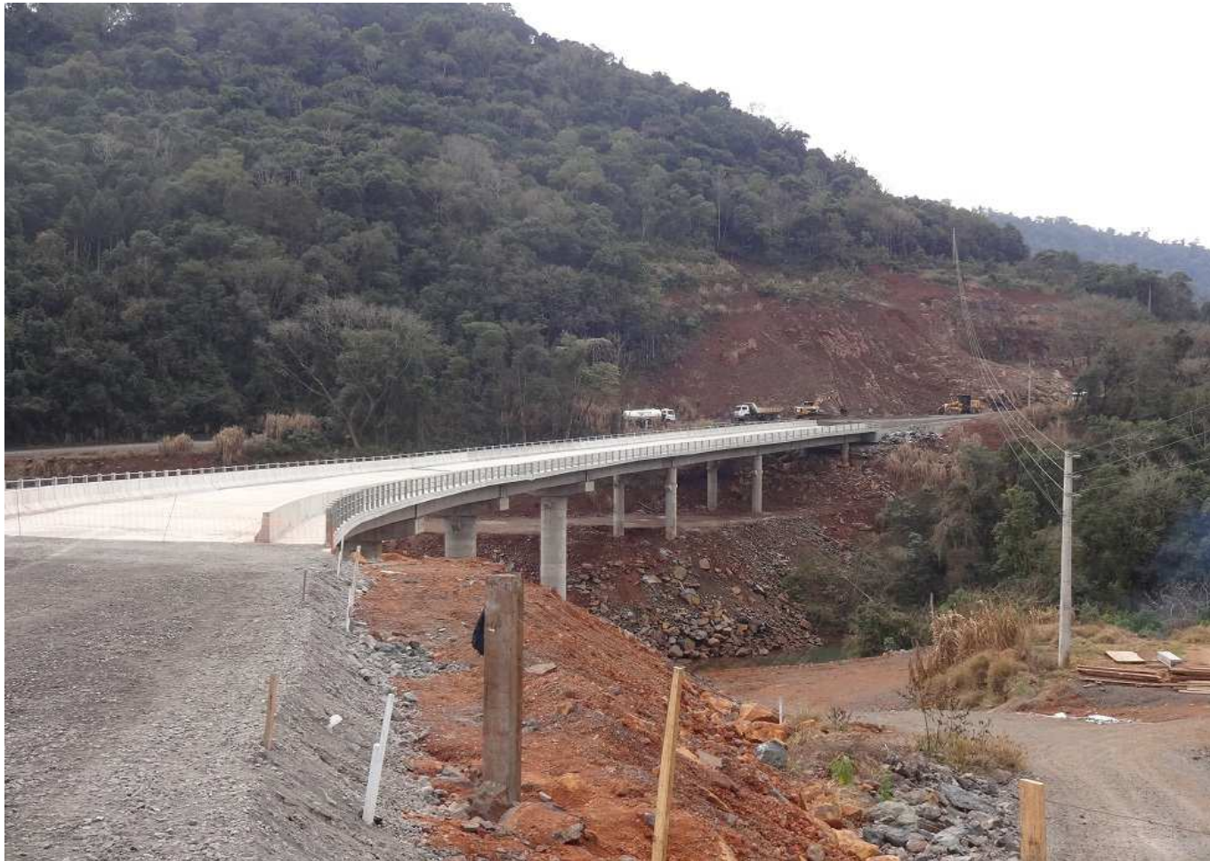
Ponte sobre o Rio Estreito, em fase final de conclusão.