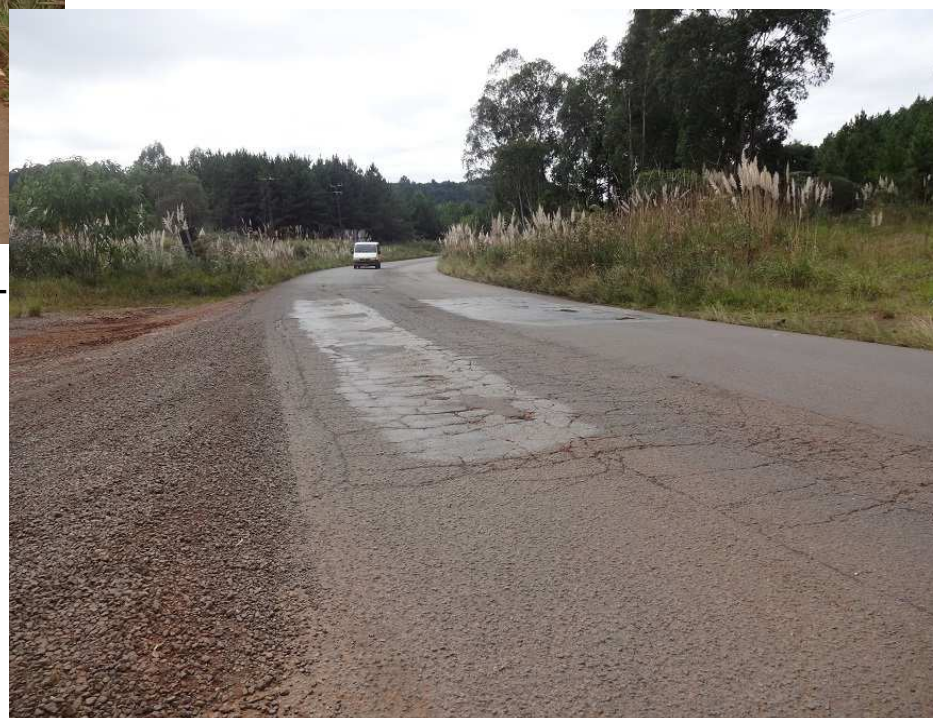
km 133 – Desagregação do pavimento