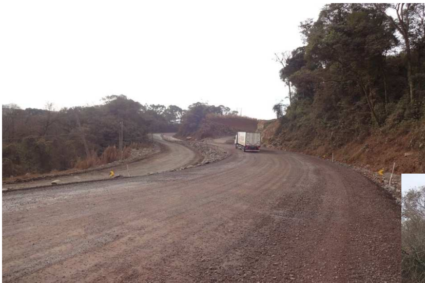
Km. 17,8 – Execução do pavimento