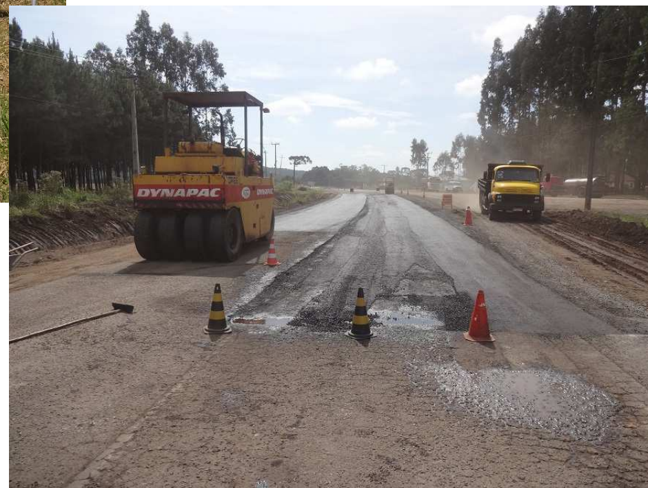
Km 3 – Obras de recuperação do DEINFRA (Em 05/04/2016)