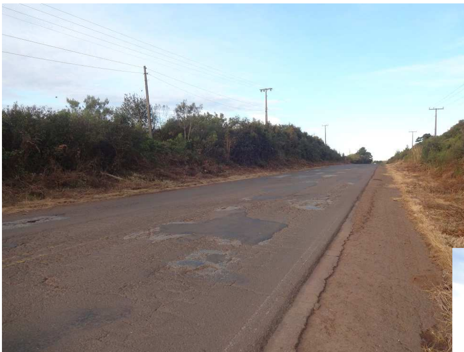
Km 27,3 – Situação do pavimento