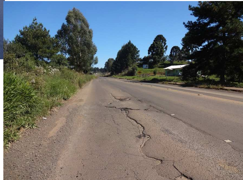
Km 185,20 – Situação do pavimento