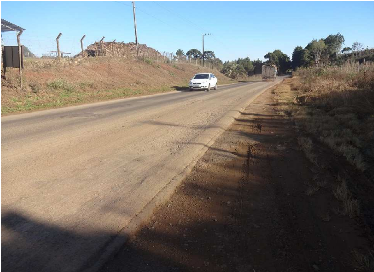
Km 19,5 – Situação do pavimento