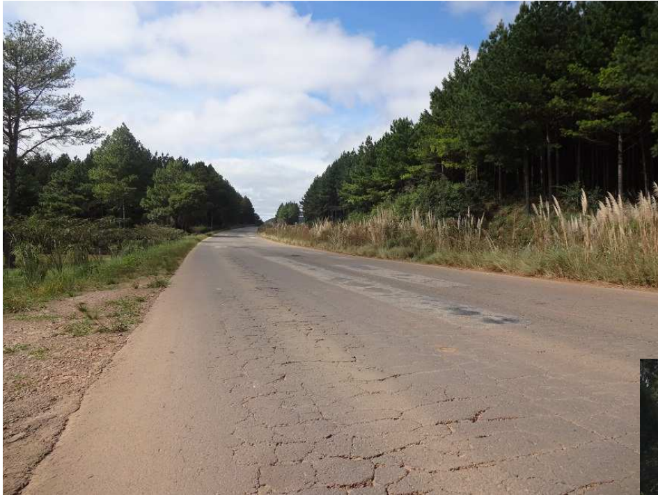
Km 129,5 – Trincamento do pavimento