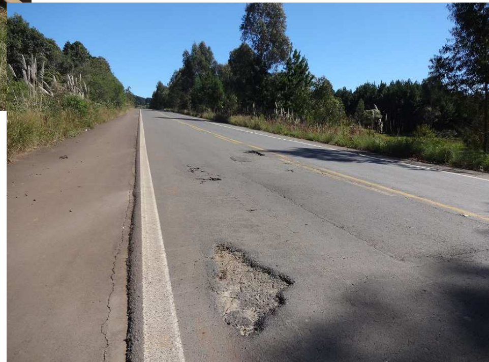
Km 223 – Buracos e recalques