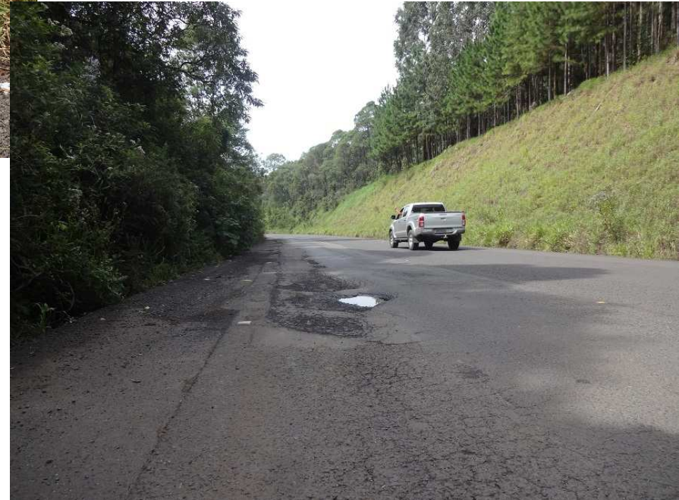
Km 11,3 – Situação do pavimento