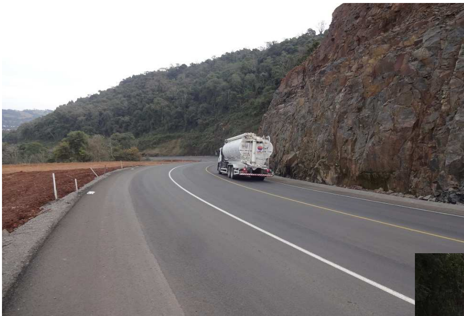
Km. 14,8 – Execução de terceira faixa.