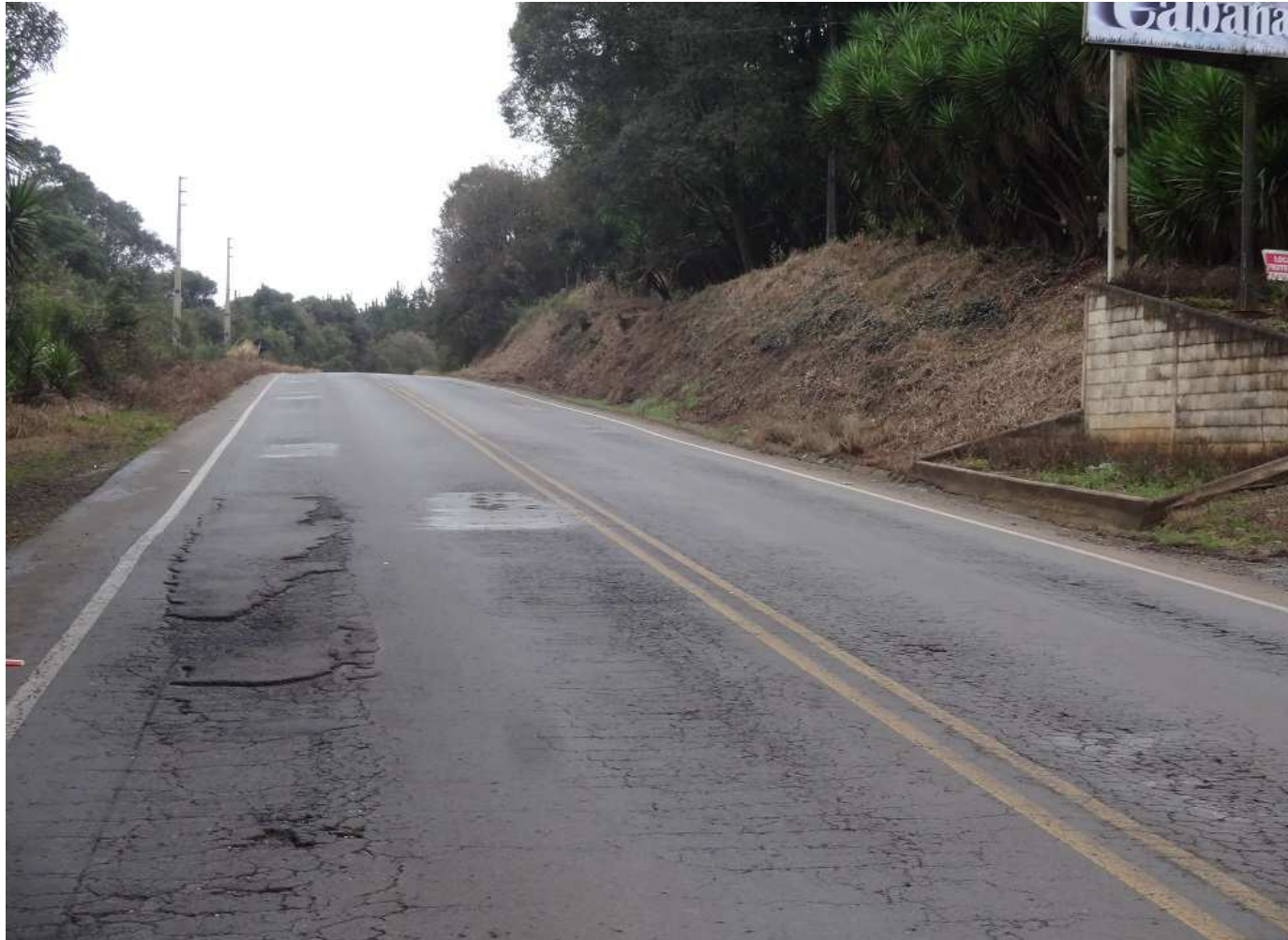
Km 116,3 – Recalques e buracos no pavimento