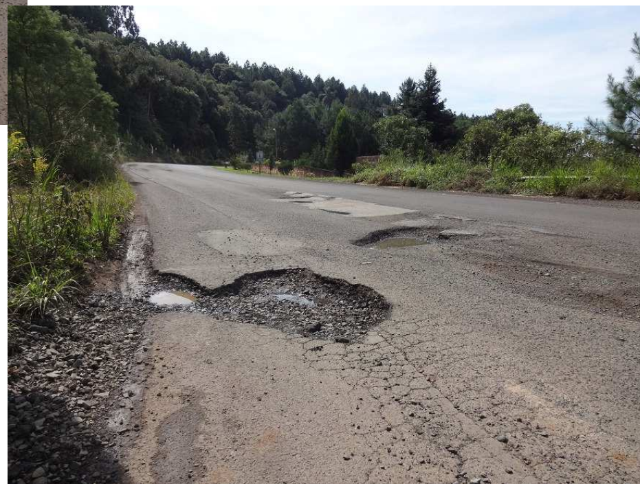
Km 16,5 – Inúmeros buracos