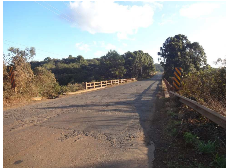
Km 11,80 - Situação da Ponte e do pavimento