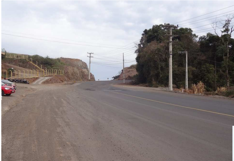
Retificação no km. 17,8