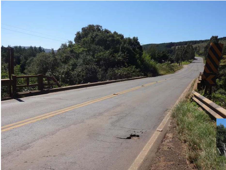
Km 213,5 – Situação da ponte