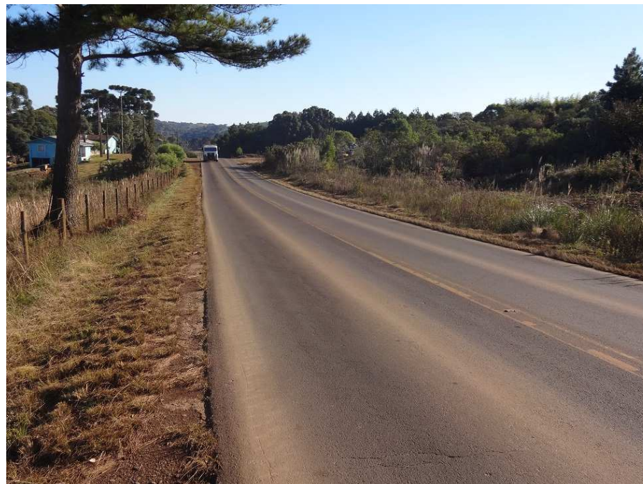
Km 27,5 – Trilha de roda e afundamento do pavimento