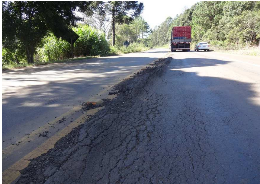
Km 178 – Afundamentos e recalques da pista