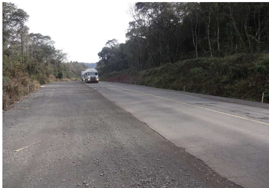
Km. 7,5 – Execução da drenagem profunda.