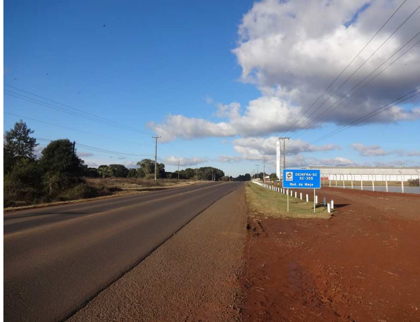
Rodovia da Maça