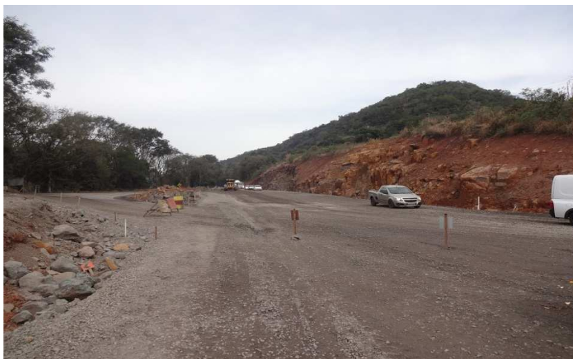
Obras de execução do pavimento na cabeceira da Ponte sobre o Rio Estreito