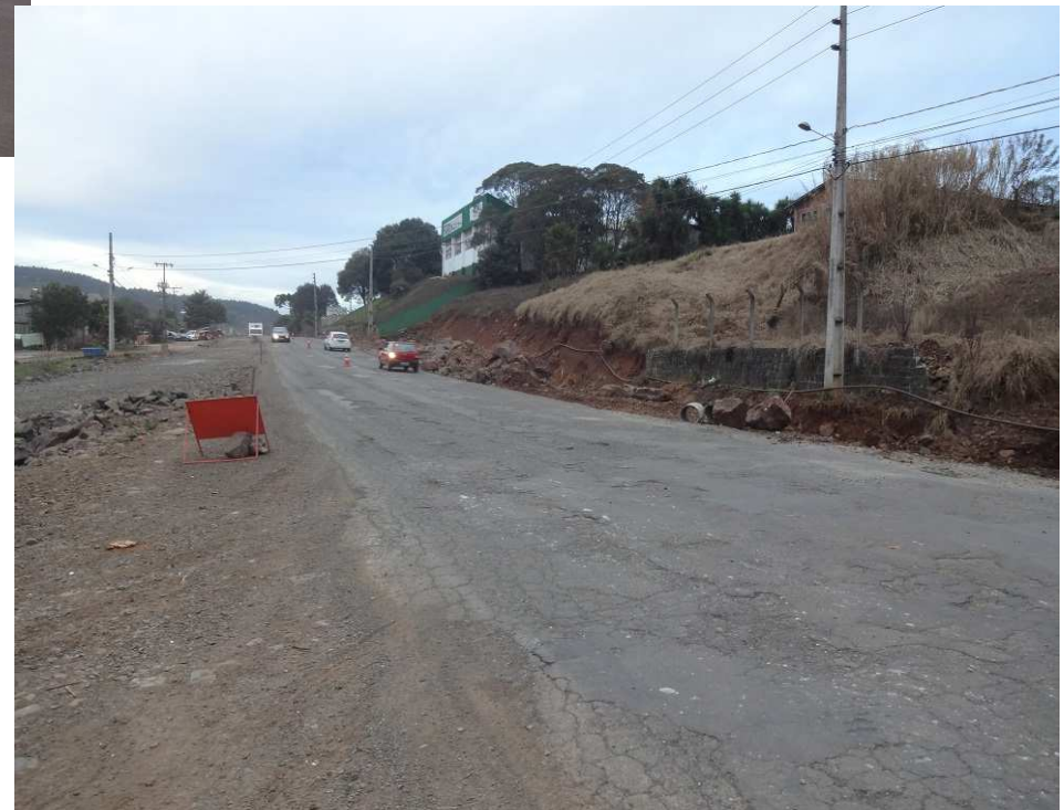
Contorno de Videira