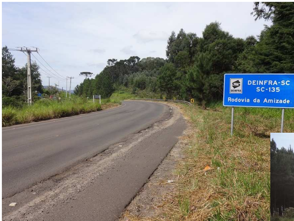
Km 0,0 – Porto União