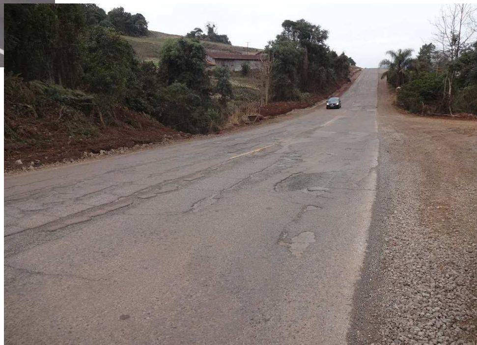
Situação do pavimento no km. 26,7